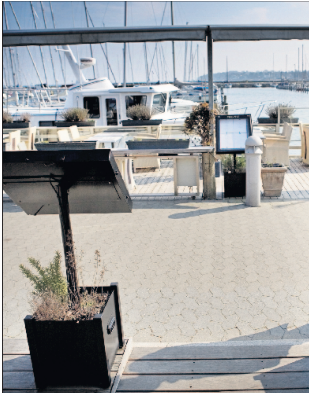
Oprydningen efter Steen Gudes kollaps blev i går afsluttet i Rungsted Havn, da de sidste af den fallerede matadors besiddelser på havnen skiftede hænder. Personen på billedet har ikke relation til sagen.

En af »lejlighederne« er solgt til internationale Mur Shipping. En anden er gået til Nelson Marine, der forhandler lystbåde. Og så er de to restauranter, Deli og Rogeriet, solgt til den samme restauratør, som nu vil dri-